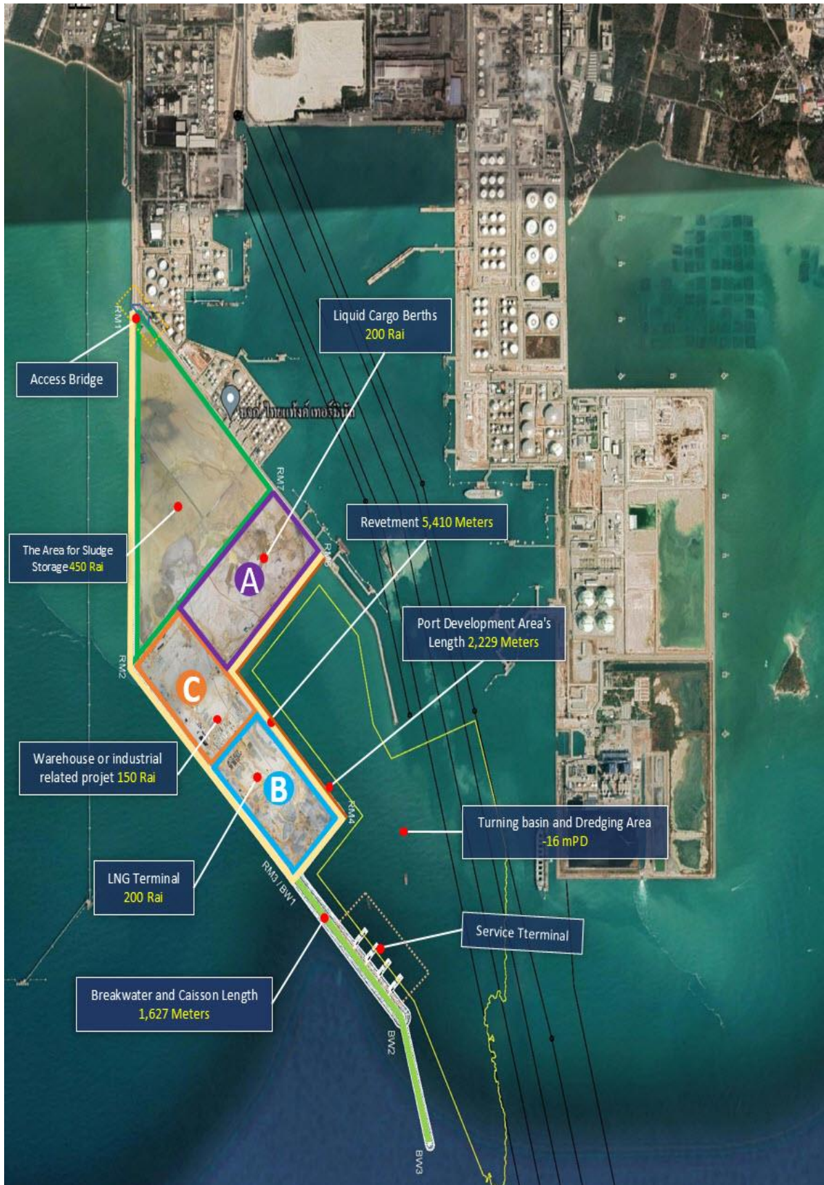
รูปที่ 1-1 รายละเอียดโครงการพัฒนาท่าเรืออุตสาหกรรมมาบตาพุด ระยะที่ 3 ช่วงที่ 1