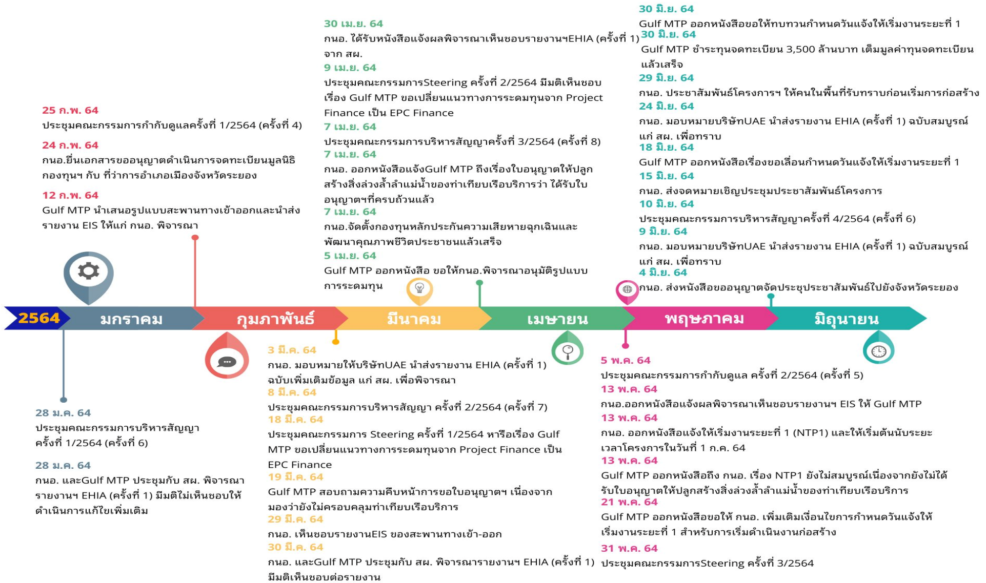
รูปที่ 2-1 การดำเนินการในโครงการ