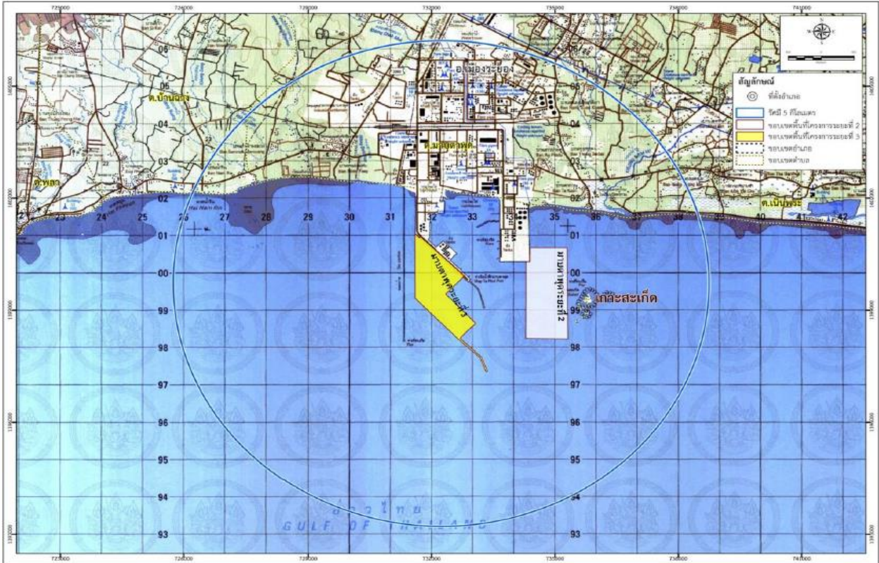
รูปที่ 1-2 ที่ตั้งโครงการ